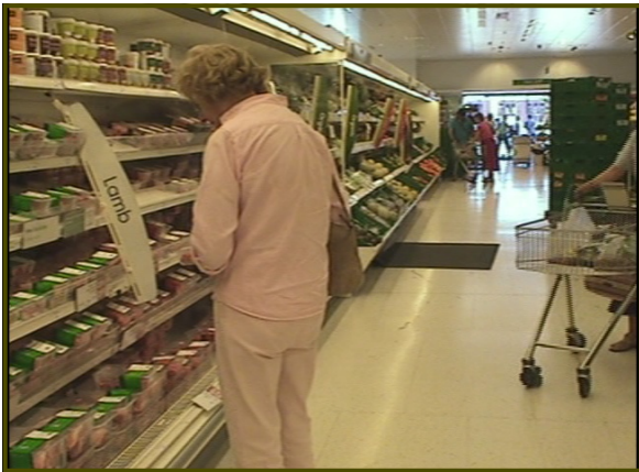
Un consommateur qui achète de l'agneau chez Waitrose